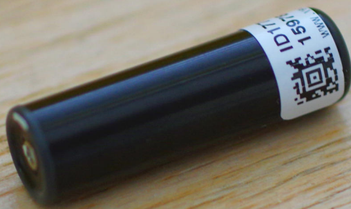
Telemetrie-Sender (im Bauchraum der Fische)