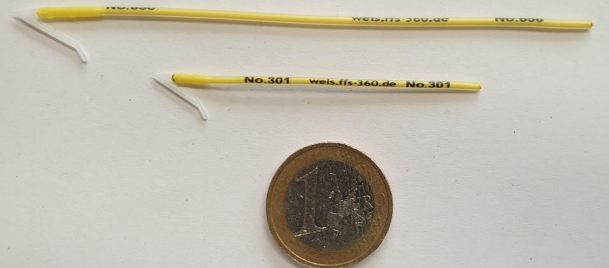
"Spaghetti-Tag" mit eindeutiger Zuweisung